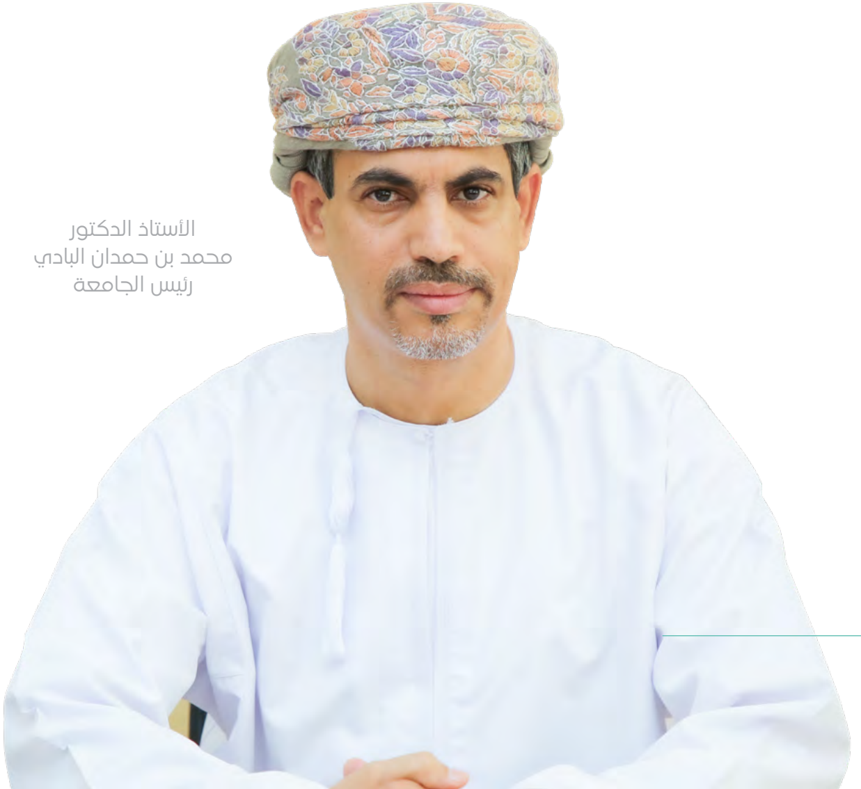
الأستاذ الدكتور محمد بن حمدان البادي رئيس الجامعة